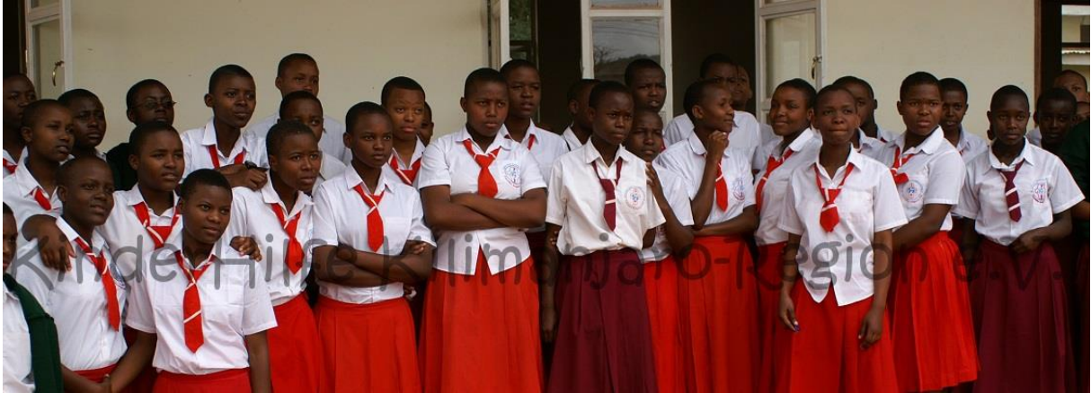
Schülerinnen der Joyland Girls Secondary School